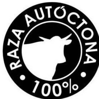
AVILEÑA- NEGRA IBÉRICA