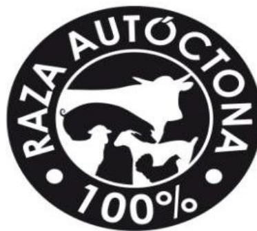
Logotipo Genérico Raza Autóctona

Existe un logotipo genérico para todas las especies y productos diseñado para su promoción, y logotipos específicos para cada especie con fines a su comercialización que irán acompañados del nombre de la raza correspondiente al pie del mismo.